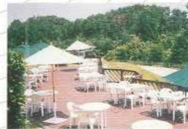
● 屋外レストランやイベント会場に据え置き