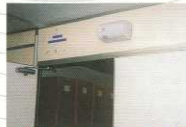
● 食品工場の前室やバックヤードの壁面に