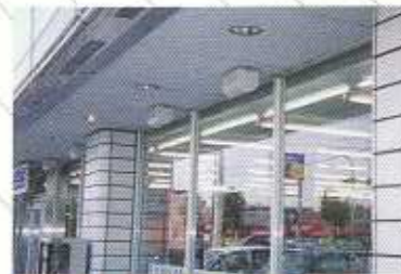
● コンビニエンスストアの入り口や風除室の天井に

ウルトラベープPROは用途、目的に応じてあらゆる場所に設置可能。据え置き、壁面、天井など場所を選ばず、害虫をシャットアウト。コンパクトなので、お客さまの目につきにくく、店内外的美観も損ねずに設置できます。