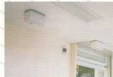
● 店頭・店内の衛生に